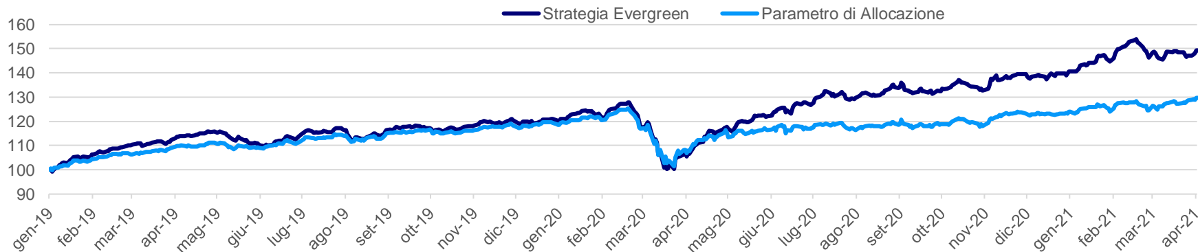
Strategia «Evergreen» vs Parametro di Allocazione dal 2019 ad oggi